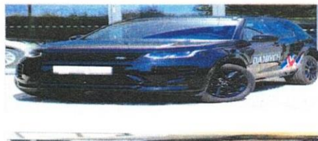
Land Rover Discovery Sport 2,0 D200 DYNAMIC SE / 7 míst

Cena: 991 653 Kč Vyrobeno: 2024 Palivo: Nafta Objem: 1997 ccm Najeto: 27 509 km Výkon: 150 kW